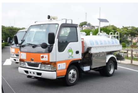
横浜市水道局マスコットキャラクター 「はまピョン」のラッピング

2台の給水車の輸送は、日本からタンザニアへの船舶輸送、及びマラウイ国ブランタイヤまでをつなぐ輸送ルートで実施しました。本プロジェクトにおいてビー・フォワードは、自社が持っている流通網や輸送にかかる費用、人的リソースなどを提供し、本プロジェクトに全面協力いたしました。引き渡した給水車は、今後、度々断水の起こる同地区において、断水時の給水支援に利用される予定です。また、今回寄贈された給水車には、ドア部分にブランタイヤ水公社と横浜市水道局のマスコットキャラクターがラッピングされています。マラウイ国への給水車輸送費用の負担とともに、ラッピングにおいてもビー・フォワードが全面的に協力し、本プロジェクトを完遂いたしました。