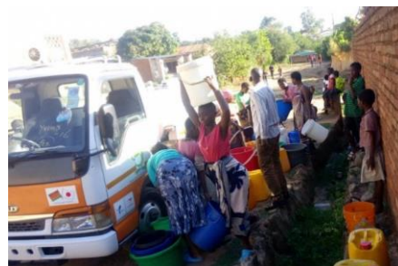
現地で給水車を活用している様子

本プロジェクトは「アフリカに一番近い都市、横浜」というスローガンを掲げる横浜市が、アフリカとの連携を一層促進するもので、アフリカ・マラウイ国への水事業への支援拡大を図るための一環として、給水車の寄贈を行うものになります。