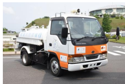
ブランタイヤ水公社マスコットキャラクター 「エレタップ」のラッピング