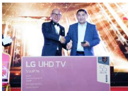
山川より賞品を受け取るモンゴルの中古車ディーラー